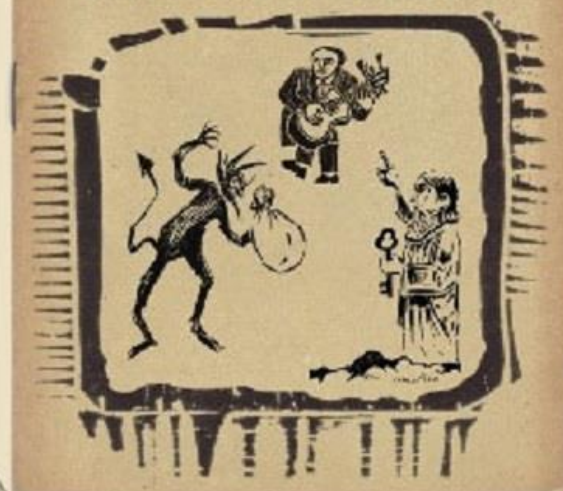
Ilustração: Mônica - Arte André Missa

Prêmio de Drama- turgia do Instituto Nacional de Artes Cênicas